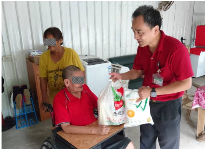
端午節物資關懷探訪