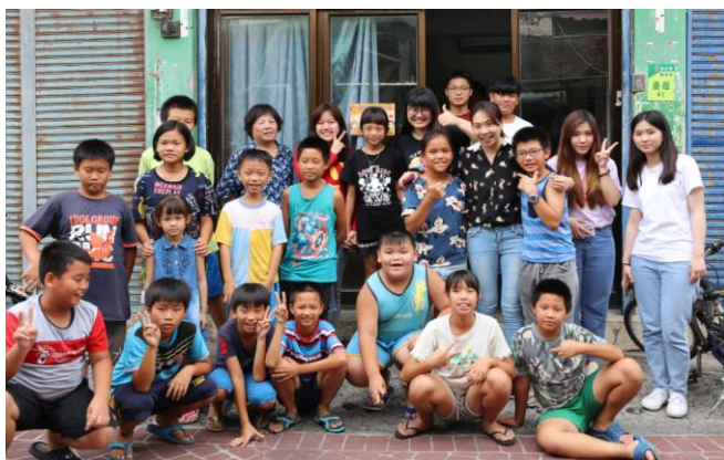
楓港課輔班(學生人數 26 人)