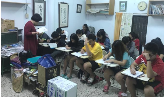
枋寮課輔班(學生人數 42 人)