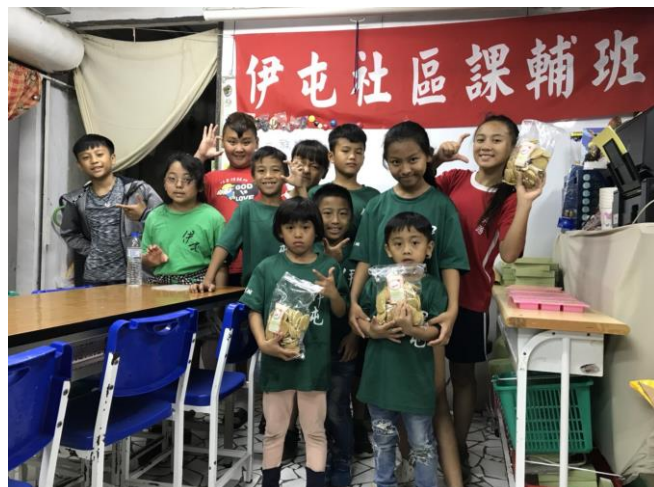
伊屯課輔班(學生人數 11 人)