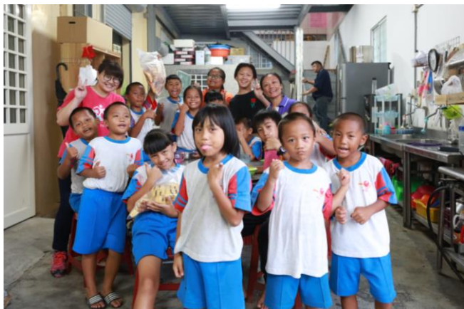
中心崙課輔班(學生人數 18 人)