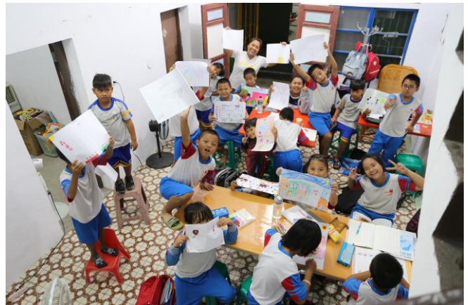
內獅課輔班(學生人數 30 人)