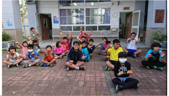
春日課輔班(學生人數 26 人)