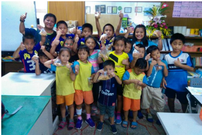
南世課輔班(學生人數 26 人)