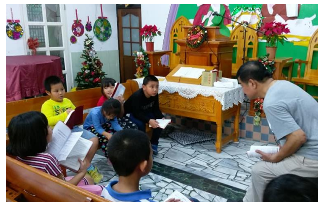
車城課輔班(學生人數 37 人)