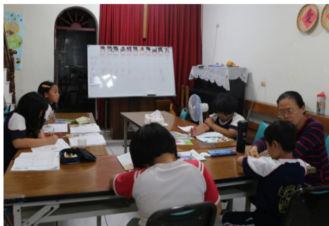
滿州課輔班(學生人數 11 人)