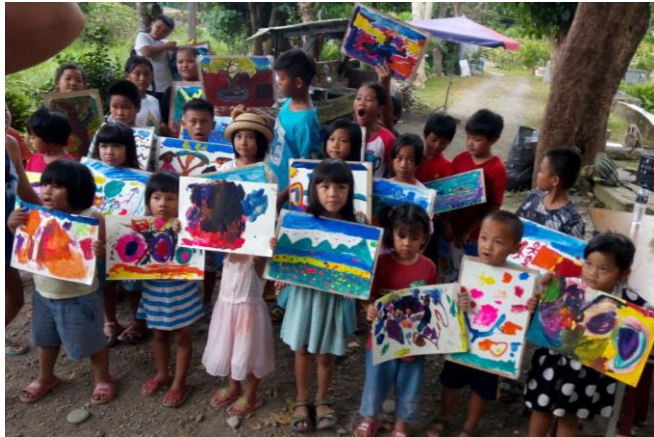
八瑤課輔班(學生人數 28 人)