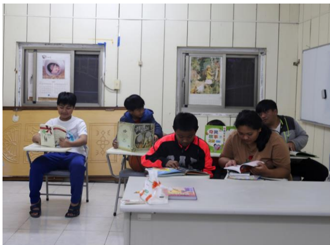
新路課輔班(學生人數 15 人)