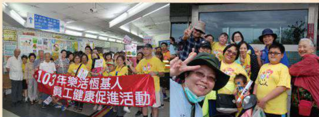
許醫師與恆基同工合影

而談到許醫師在恆春半島的行醫時光，除了對患者的付出與照顧以外，與許醫師相處過的資深同仁無不讚嘆「阿公那放下身段的愛」，他不看自己的位份、不看自己有多少豐功偉業，乃是將自己所能