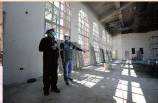
看診之餘，仍然心繫新大樓的進度

不只要看門診、病房，甚至需要值24小時急診，最高值班次數長達一個月18班。那時有時候忙到太累，身體很疲勞，就自己跑到墾丁的麥當勞買兒童餐吃，除了讓自己從緊張的醫療工作中抽離一下，更是為了幫女兒收集兒童餐的玩具。然而，密集的連續值班更導致他心律不整，他說：「那時候我在急診，就叫護士把電擊器推過來，指導他們隨時要幫我電擊。」工作的辛勞之外，對家人的思念更是令黃院長相當煎熬，想到孩子需要父親，常常讓他心裡很過不去，他就會一個人到海邊哭泣。這時神就會用話語來安慰他，有一次神透過《聖經》上對以色列百姓所說的話：「我是你的神，我是耶和華，我與你同在，不要害怕。」因著這一席話，讓他從潰堤的情緒中平靜下來。