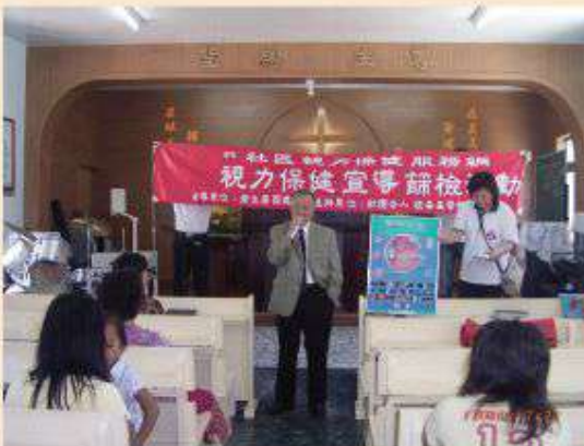
進入部落為民衆作視力保健宣導