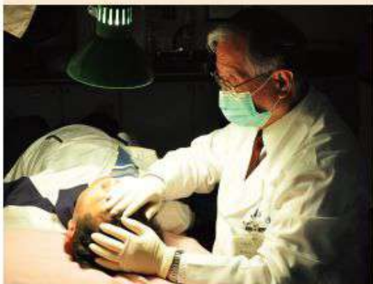
陳醫師為病人檢查眼睛術後的恢復情況