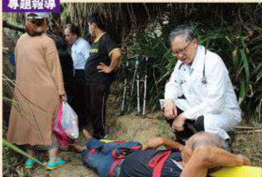
率領恆基團隊至無水、電的病人家立刻就援