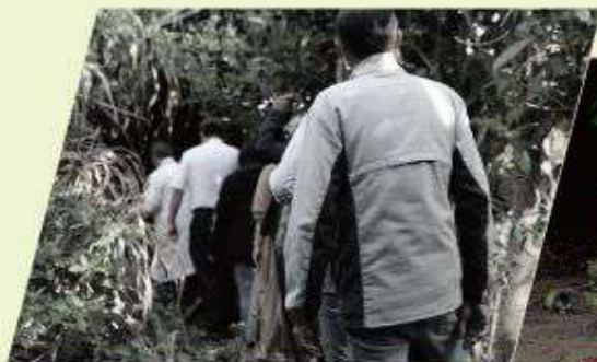
恆基醫療團隊展開一連串愛的行動