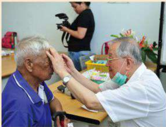
陳醫師至東源部落醫巡