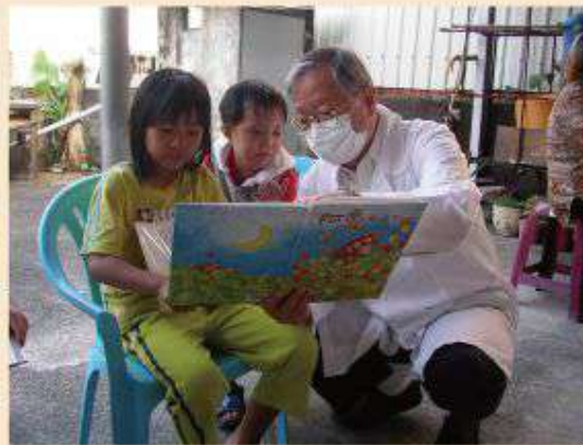
醫巡後與小朋友們共讀說故事