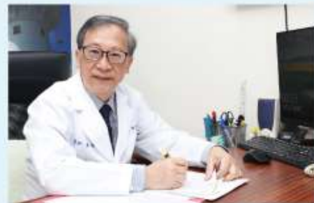
恆春基督教醫院 院長

「這一場防疫戰，沒有人是局外人。」每一個人都在各自的崗位上，恆基也會竭全力來守護台灣尾，我禱告，期望上帝的平安與喜樂常存在我們心中，加添力量給每一位守護家園的保衛者，更盼望上帝的醫治臨到，耶穌死裡復活的大能勝過一切疾病。