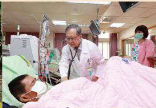
為腎友的健康把關