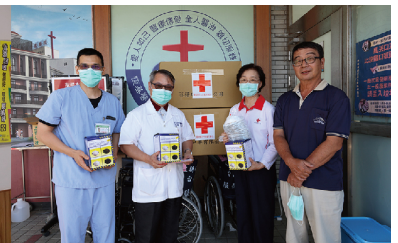
5/11紅十字會贈隔離衣、檢診手套、N95口罩