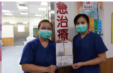
5/8竹田國小小朋友的加油、打氣卡片