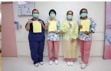
4/29婦聯會捐贈300件防護衣助恆基防疫