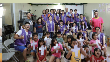
大直長老教會 至關懷八瑤課輔班小朋友