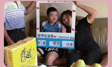
社工同仁至個案家送中秋關懷物資

恆基衷心感謝社會大眾對台灣尾獨居弱勢長輩的關心與照顧，因著您的愛心，使恆春半島獨居弱勢的長輩們在中秋佳節享有關懷禮。 恆基愛心宅急便，把愛送到長輩手中，點亮弱勢獨老的心。