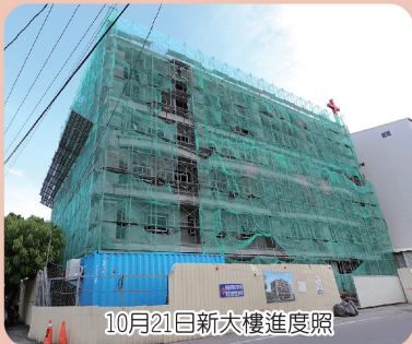
10月21日新大樓進度照

恆愛護理之家護理師、恆愛護理之家照顧服務員、病房照顧服務員、急診護理師、內科專科護理師、加護病房護理師、居家督導員、開刀房護理師、藥師、小兒科醫師、眼科醫師、一般內科專科醫師、家庭醫學專科醫師