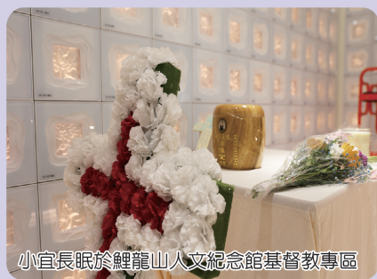
小宜長眠於鯉龍山人文紀念館基督教專區