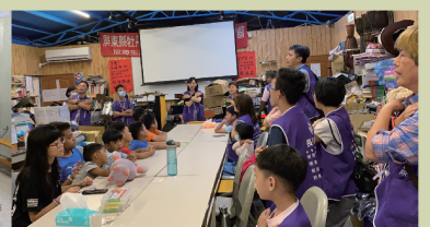
桂格活水教會 與旭海課輔班小朋友互動