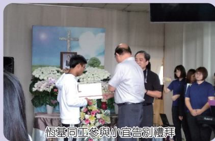
恆基同工參與小宜告別禮拜

宜，騎在熟悉的路上，經過她每天都會騎過的路口。但那一天，小宜再也沒有回家。一輛車駛過，發生了車禍，她的生命就停在那個為家人付諸心力，前往打工的早晨。