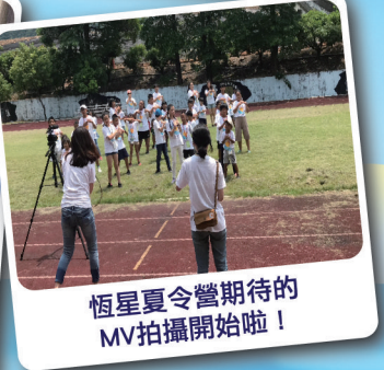
恆星夏令營期待的MV拍攝開始啦!