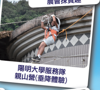
陽明大學服務隊親山營(垂降體驗)