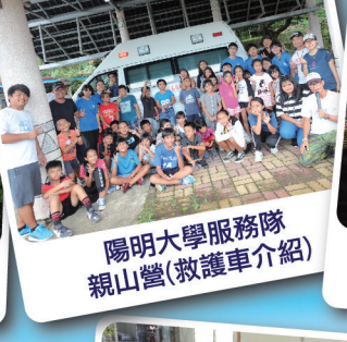
陽明大學服務隊親山營(救護車介紹)