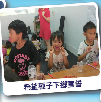
希望種子下鄉宣普