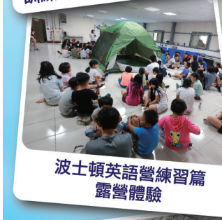
波士頓英語營練習篇露營體驗