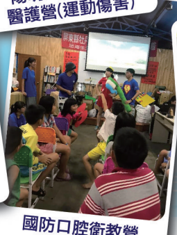
國防口腔衛教營話劇演出