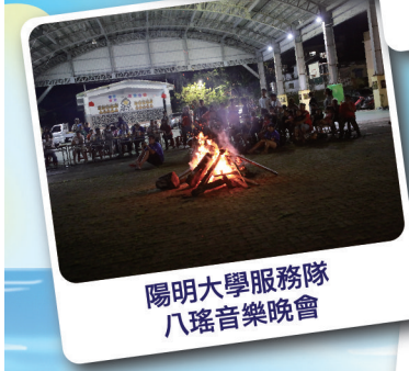
陽明大學服務隊八瑤音樂晚會