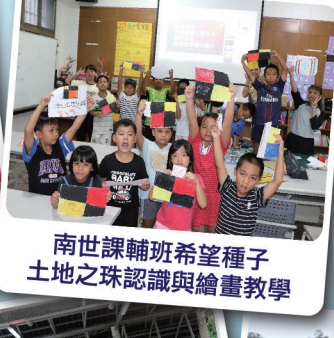
南世課輔班希望種子土地之珠認識與繪畫教學