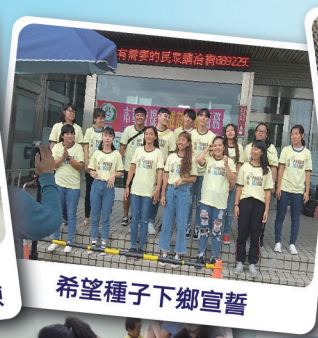
希望種子下鄉宣普