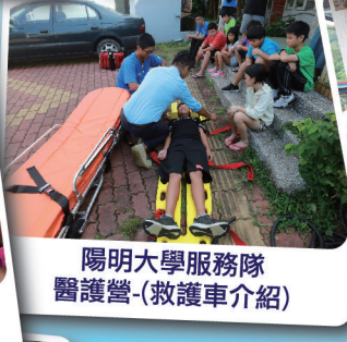
陽明大學服務隊醫護營-(救護車介紹)