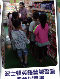
波士頓英語營練習篇農會採買趣