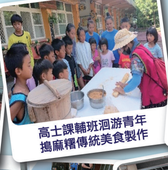
高士課輔班洄游青年搗麻糬傳統美食製作