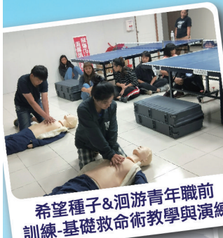
希望種子&洄游青年職前訓練-基礎救命術教學與演練

每到暑期，恆基總是特別的熱鬧，同仁忙進忙出的同時，是看見孩子們笑顏及聽見最多歡笑聲的日子。恆基為縮短城鄉的差距，讓恆春半島孩童及恆基偏鄉弱勢課後輔導班學童暑期有豐富的營隊體驗與學習，今年共計八組營隊：台電希望種子、台北市全球健康教育協會洄游青年、波士頓英語營、陽明大學服務隊-醫護營、陽明大學服務隊-親山營、國防口腔衛教營、恆星夏令營、海洋營。除了完成暑假作業也增長知識，生活英語、性別教育、營養、醫護、親海...等課程，暑期樂學並愛與陪伴不間斷，孩子們說：「今年暑假怎麼那麼好玩啦！」。