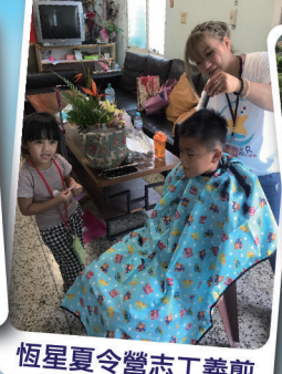
恆星夏令營志工義剪