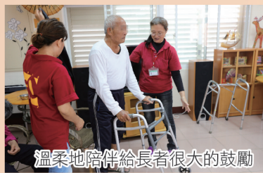
溫柔地陪伴給長者很大的鼓勵

區。對於生活在這片土地上黑暗角落的人們，她內心有著一份說不出但深厚的情感。自美月姊是照顧服務員時就負責的一戶住在車城鄉的葉姓家庭，由生病的兒