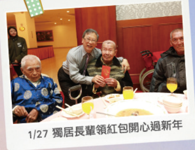
1/27 獨居長輩領紅包開心過新年