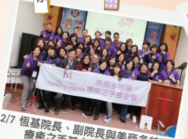
2/7 恆基院長、副院長與美商多特瑞 療癒之手基金會志工合影