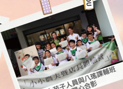
1/5 大苑子人員與八瑤課輔班 學童開心合影