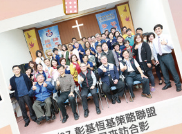
2/27 彰基恆基策略聯盟 彰基人員來訪合影