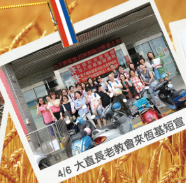
4/6 大直長老教會來恆基短宣