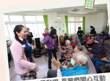
2/2 社工帶動唱 長輩們開心互動