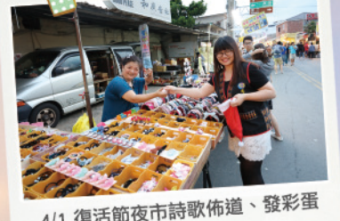
4/1 復活節夜市詩歌佈道、發彩蛋