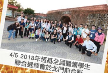
4/5 2018年恆基全國醫護學生 聯合退修會於北門前合影