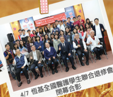
4/7 恆基全國醫護學生聯合退修會 閉幕合影