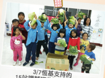
3/7 恆基支持的 15站課輔班收到愛心高麗菜