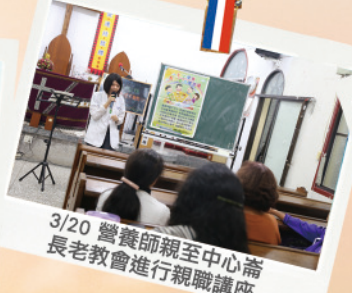
3/20 營養師親至中心 長老教會進行親職講座