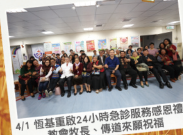
4/1 恆基重啟24小時急診服務感恩禮拜 教會牧長、傳道來願祝福