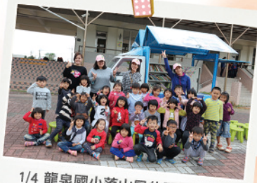
1/4 龍泉國小落山風的閱讀派對