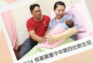
3/24 恆基喜獲今年第四位新生兒