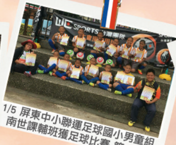
1/5 屏東中小聯運足球國小男童組 南世課輔班獲足球比賽 第一名