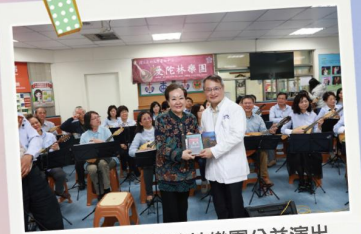
2/14 成大曼陀林樂團公益演出