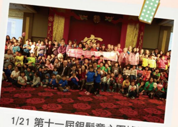
1/21 第十一屆銀髮童心圍爐樂