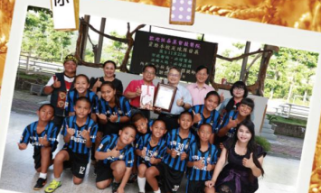
5/5 恆基支持的內壢國小足球隊獲全國少年盃第五名