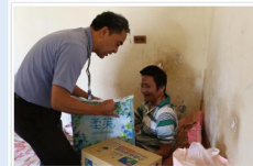
林傳道帶著物資關懷探訪 親切的問候使長者備感窩心