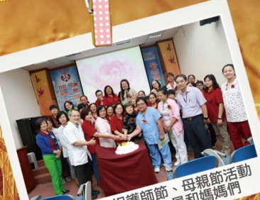
5/11 恆基慶祝護士節、母親節活動慰勞辛苦的醫護人員和媽媽們