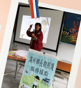
3/15 九棚社區關懷照護宣導