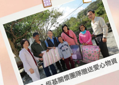
1/10 恆基關懷團隊贈送愛心物資