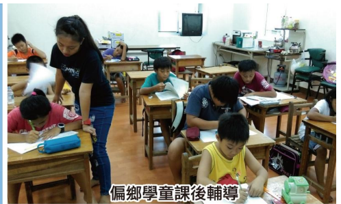
偏鄉學童課後輔導

衛部教字第1051363442號【風雨中堅守崗位，重建守護台灣尾】／衛部教字第1051363593號【照顧台灣尾仔仔 偏鄉課輔專案】