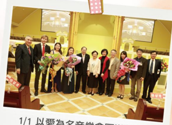
1/1 以愛為名音樂會圓滿落幕