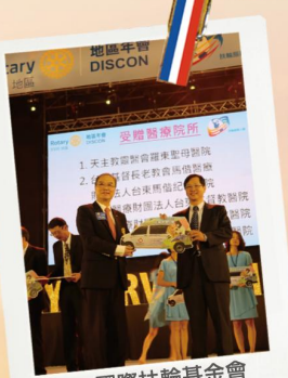
4/8 國際扶輪基金會捐贈超音波巡迴醫療車