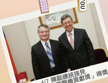
4/7 陳副總統接見「第七屆臺灣兒童醫療貢獻獎」得獎人