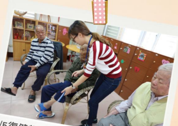
4/5 復健師至車城日照中心老寶貝復健