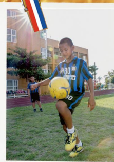
5/5 孩子們在足球上找到自己的天賦