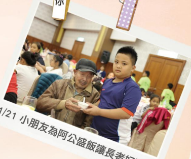
1/21 小朋友為阿公盛飯讓長者好開心