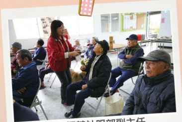
3/15 恆基社服部副主任親至現場為VUVU們上課