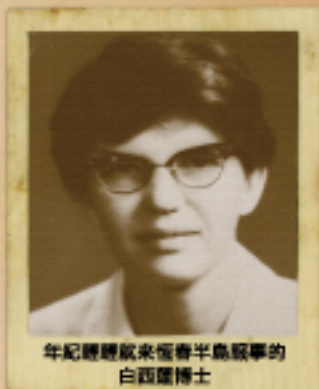
年紀雖輕就來恆春半島服務的白西蓮博士

60多年過去了，當初那棟香濃的日式房屋已不見了，與土木之許多木造房子，但是海山風還在，這棟的尋覓還在，這分憂慮還在，所以改年自我們向司以此別開了「風之巢」的序次，來傳遞這份憂慮與希望。