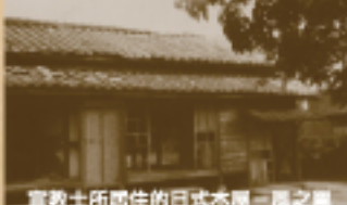
宣教士所居住的日式木屋—風之巢