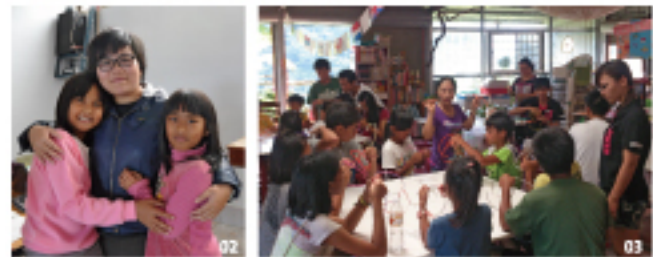
01 東源課輔班上課情形 02 本院曾導訪課輔班 03 高士課輔班一歷史文化課程 04 高士、八瑤課輔班文化傳承 05 高士古謠隊