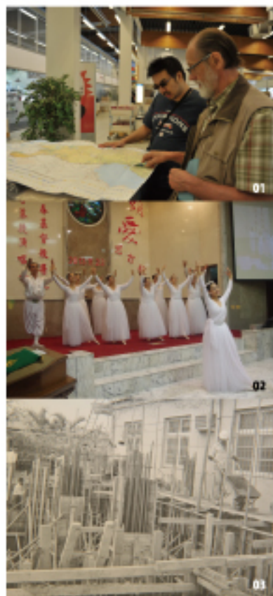
永勳與牧師討論拜訪路線 01 頌愛音樂會優美的芭蕾舞演出 02 恆基興建時的景況 03