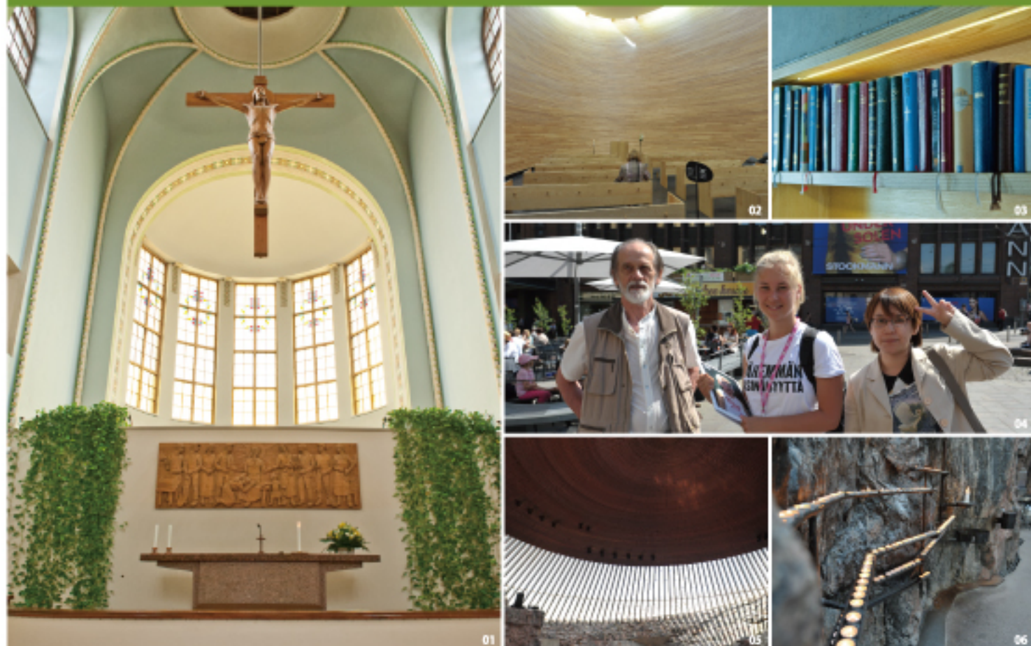
01 Kallio 教堂講台 02 Kamppi 靜謐教堂 03 Kamppi 教堂內提供各國語言的聖經 04 芬蘭年青人為海外宣教學工街頭募款 05 岩石教堂的頂部 06 岩石教堂內為海外宣教祈禱的蠟燭