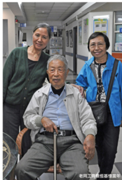
老同工與恆基禮堂年