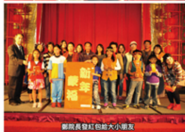
鄭院長發紅包給小朋友