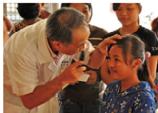
▲短期醫療幫助部落居民