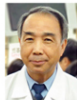
恆春基督教醫院 院長