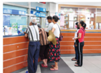
▲恆基致力於提升偏鄉醫療品質