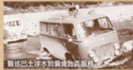
醫巡巴士涉水到偏遠地區服務