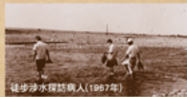
徒步涉水探訪病人(1967年)