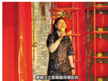
廖婉儀立委親臨現場致詞

恆基相當感謝屏東縣政府和屏基給我們服務老人家的機會，在強大的落山風吹拂的冬日，溫暖的雞湯正是及時的溫暖，不僅能溫暖老人家的胃，更溫暖他們的心。（圖：恆基和屏基同心關懷長者）