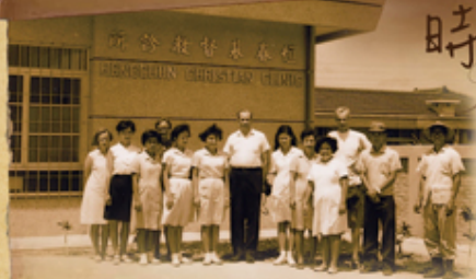
左圖：恆基創始時期診所(1969年)

走過57個年頭，恆基佇立於台灣尾守護著恆春半島這塊土地。回顧過往，我們步步艱辛、也步步恩典。在即將邁向60週年的此刻，讓你、我一起用老照片來追憶每一段愛的痕跡是如何成就愛的「恆基」。