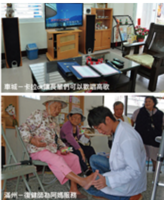
車城一卡位，讓長輩們可以歡聚高歌

走訪恆春半島偏鄉，我們看過許多老人家，現有的照顧服務已經無法滿足他們的需求；許多長輩因為失智，家人怕他們亂跑，白天又得為家計奔波，所以只好把他們關在小房間裡，免得走丟了；有得甚至失能臥病在床，每天也只能無奈地在床