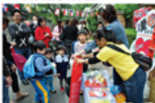
大小朋友齊來支持