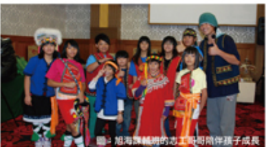
圖：旭海課輔班的志工協助陪伴孩子成長

而在假日和寒暑假每天也會特別安排各界社團和學生志工，來陪伴寫作業或帶活動及戶外教學，讓孩子就不會因獨自在家或到河、海邊發生危險。未來則希望恆春基督教醫院能繼續協助我們，讓課輔班可以繼續照顧這群需要愛和關懷的孩子們。